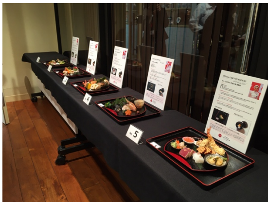
(完成した全選手の料理)